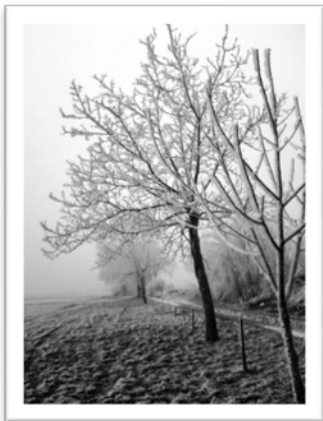
Anja Senjan, 4.b