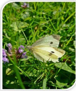
Dunja Bonačić, 3.a