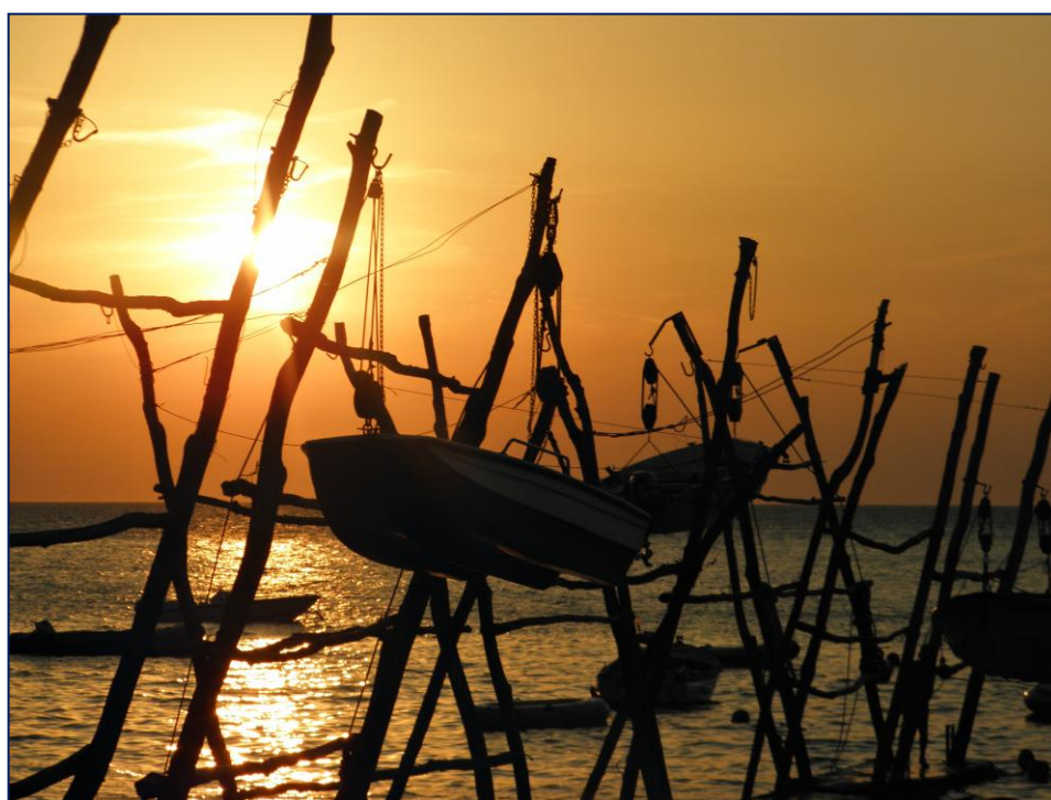
„Uplovljavanje u suton“ – Anja Marušić, 3.b